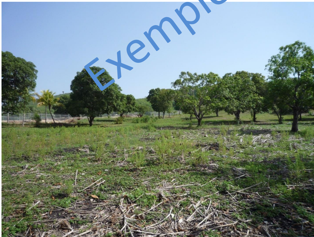
Photo actuelle du site