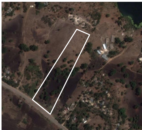
Vue Google Earth du site