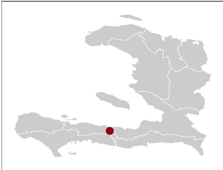
Localisation sur carte Haïti

Schweizerische Eidgenossenschaft Confédération suisse Confederazione Svizzera Confederaziun svizra